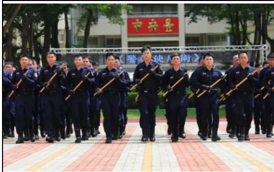
靖安小組戰技演練