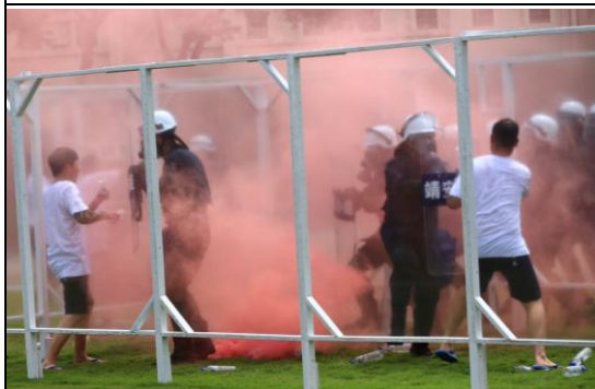
組員迅速鎮壓暴動收容人