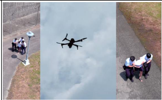
首度採用無人機巡防捕獲脫逃者