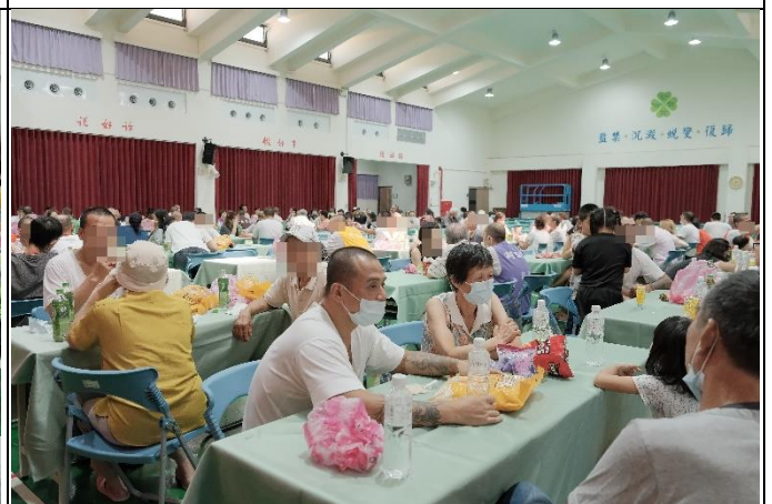
面懇活動現場實況