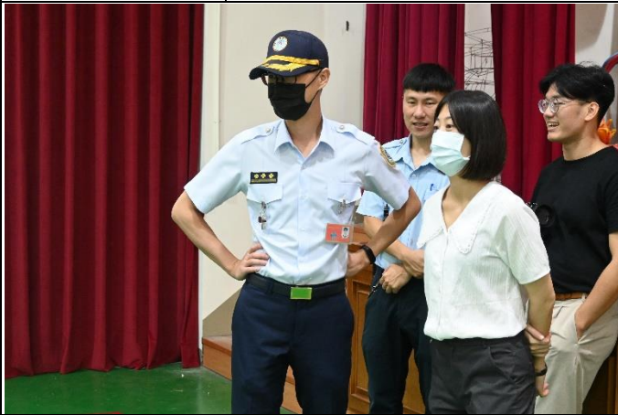
專員關心比賽現場