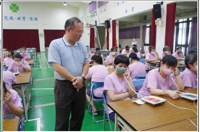
王秘書恩先關心電懇現場