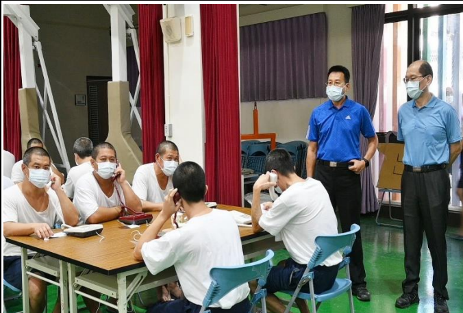
許典獄長金標關心電懇現場