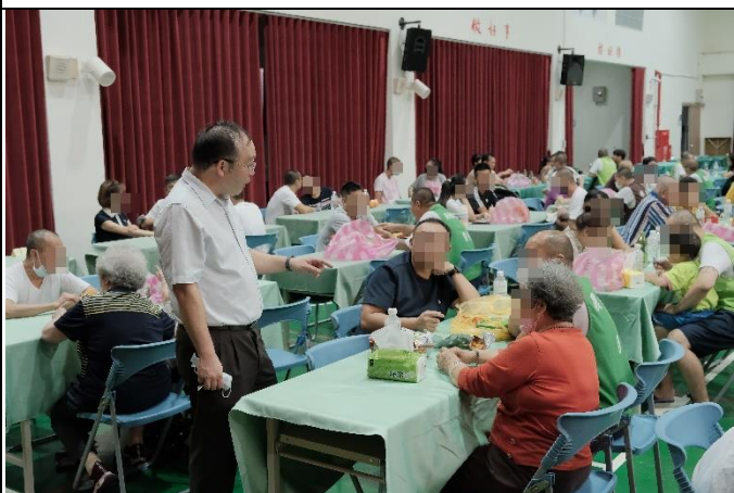
王秘書恩先關心面對面懇親現場