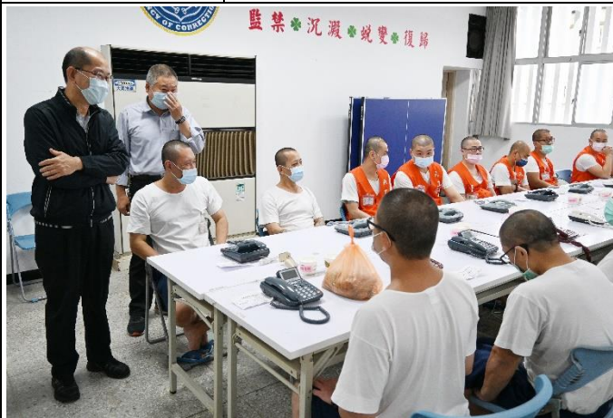
許典獄長金標關心撥打情形