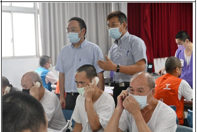
教化科周科長關心撥打情形