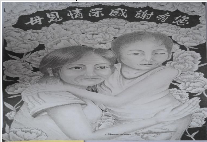
第一名:母恩深情感謝有您