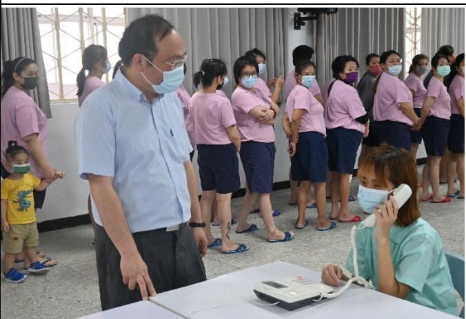
王秘書關心撥打情形