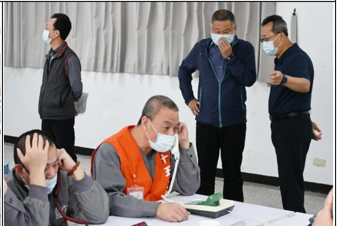
簡副典獄長永池關心撥打情形