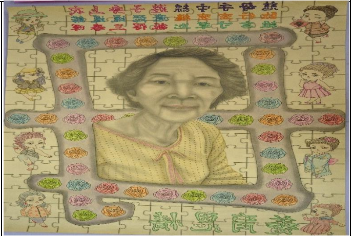
第二名:阿嬤的養育恩情