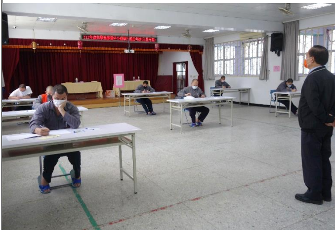
收容人專心應考情形