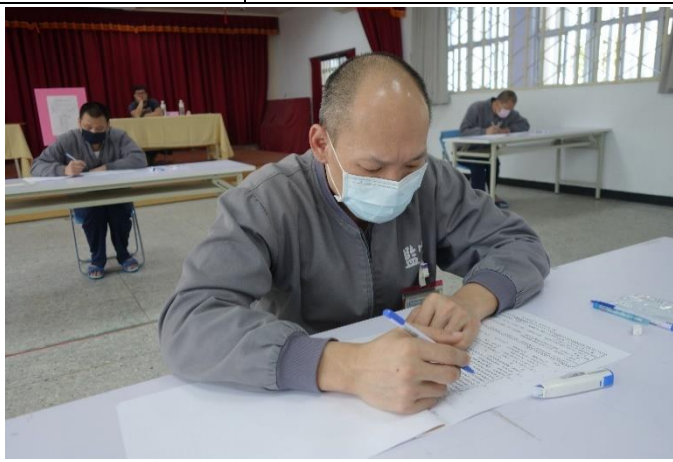
收容人專心應考情形