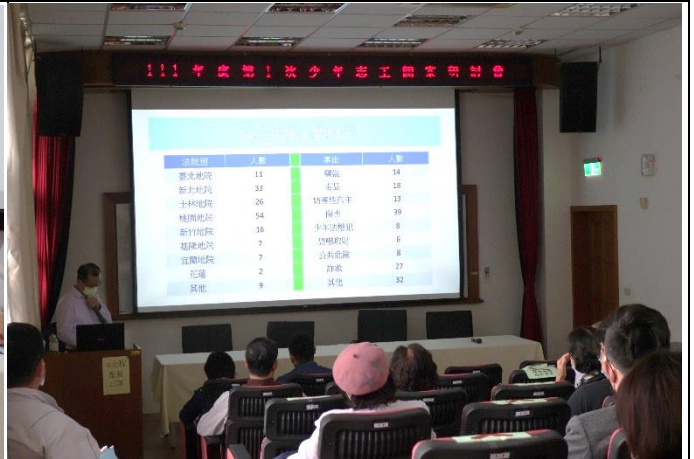
王秘書進行專題演講