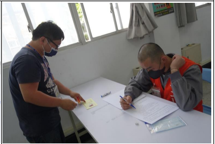
收容人專心應考情形