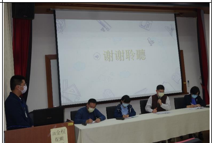
專家指導回饋現場