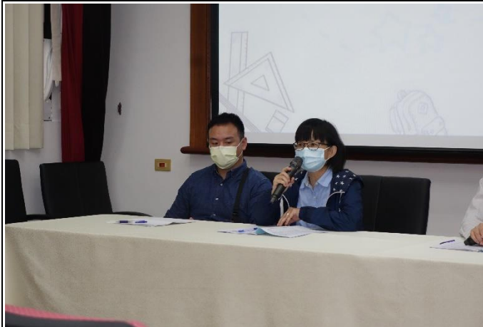
賴輔導員擔任專業指導