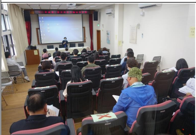
個案報告問題研討