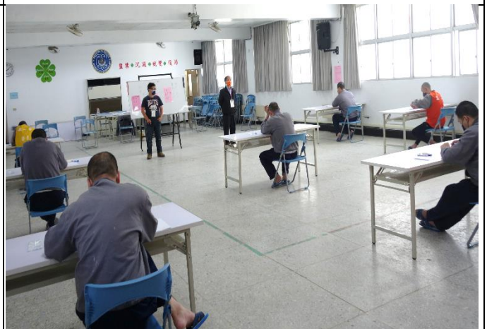
收容人專心應考情形