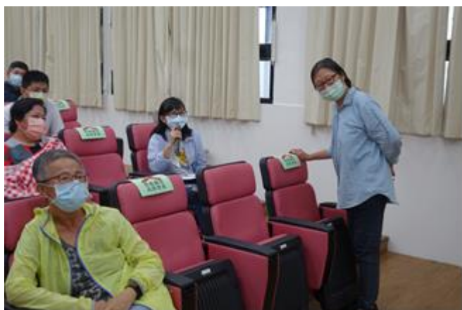
賴輔導員輔導經驗分享