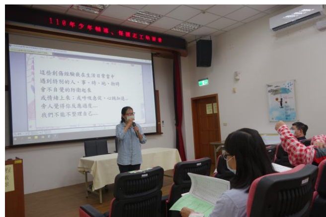
萬教授進行專題演講