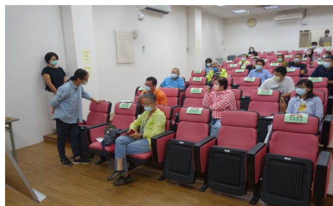
志工問題研討交流