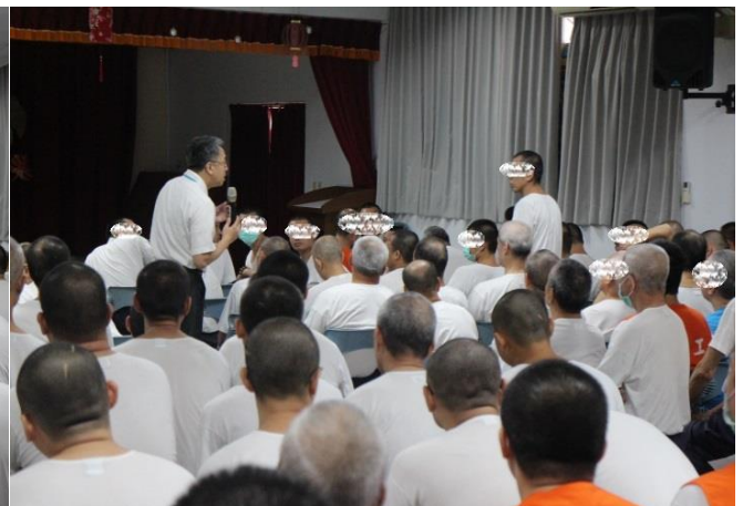
處遇課程現場實況