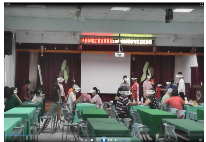
女監收容人現場實況