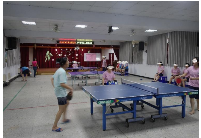
女監收容人比賽現場實況