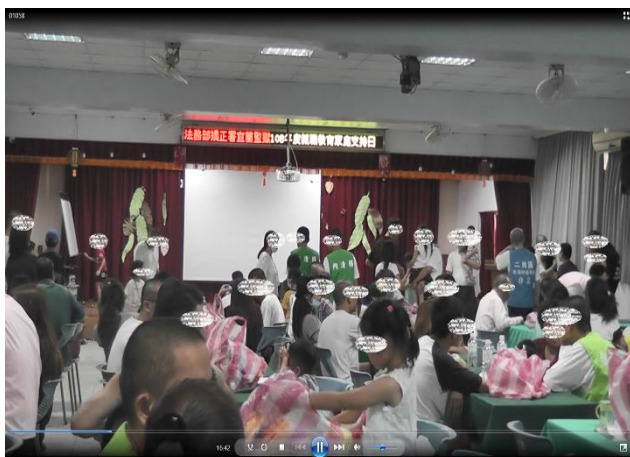
男監收容人現場實況