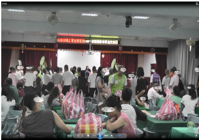
男監收容人現場實況