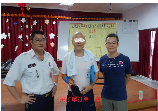
男監收容人單打比賽冠軍