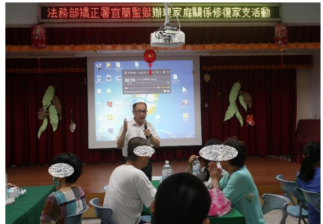
教化科張科長致詞