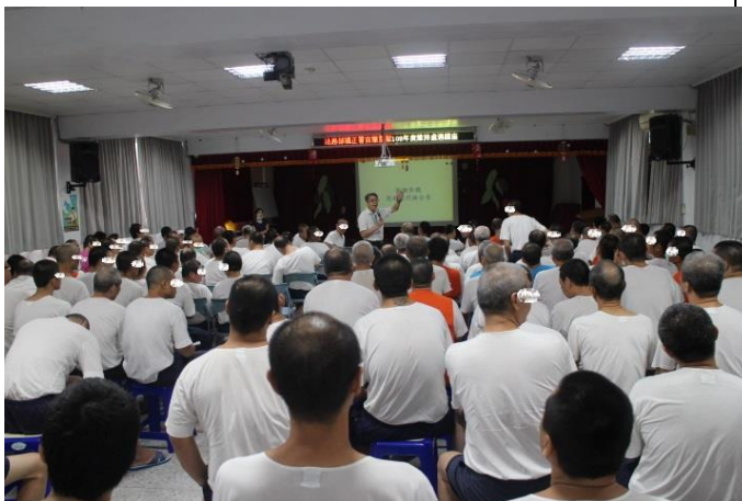
處遇課程現場實況