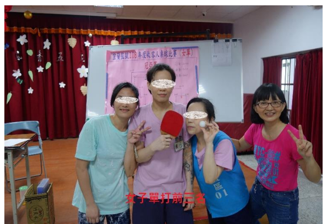
女監收容人單打比賽前三名