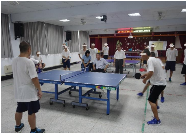
男監收容人比賽現場實況