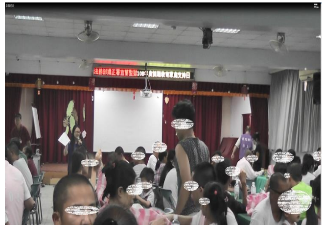
男監收容人現場實況