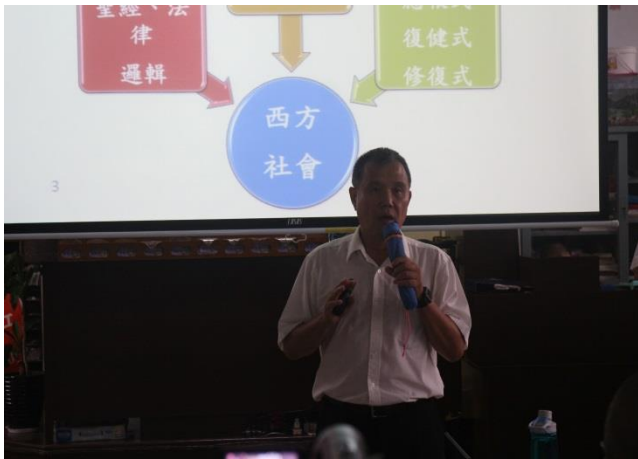
柴漢熙促進者宣導實況