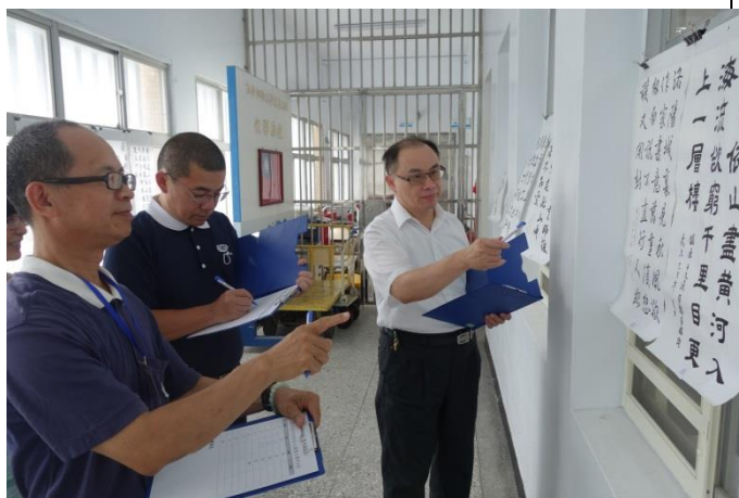
評審評比現場實況