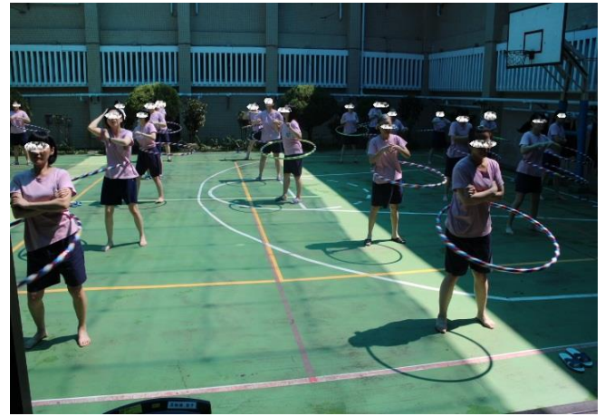
女監收容人比賽現場實況