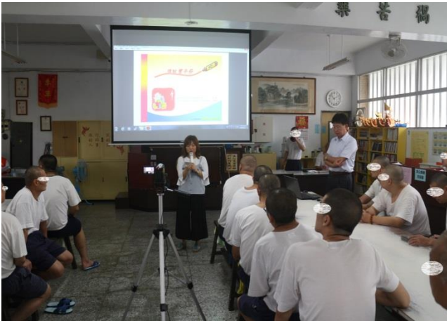
由專區老師介紹本次演講人