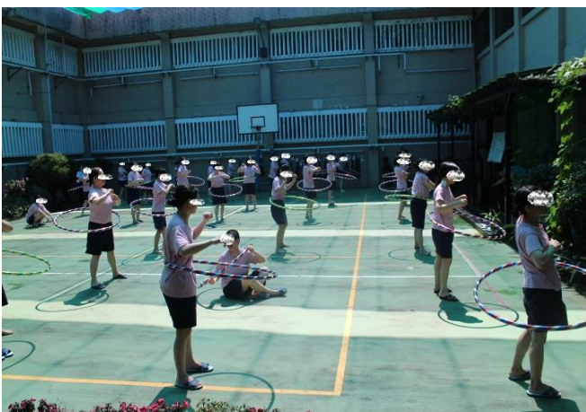
女監收容人比賽現場實況