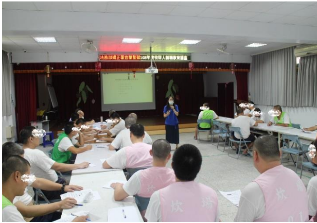
男監收容人宣導實況