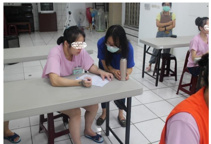
女監收容人宣導實況