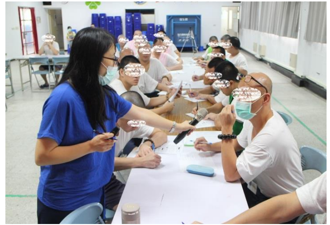
男監收容人宣導實況