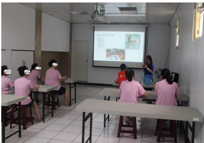
女監收容人宣導實況