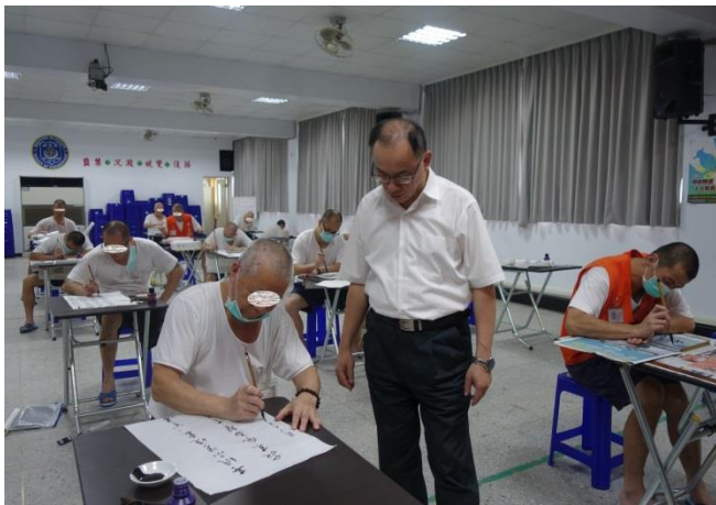
書法比賽現場實況