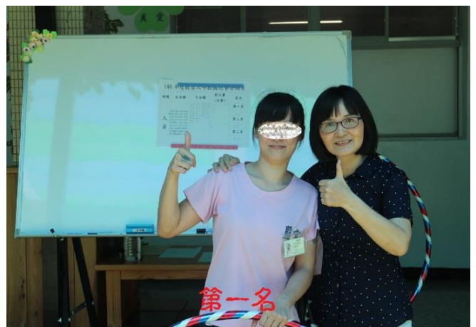
女監收容人比賽冠軍