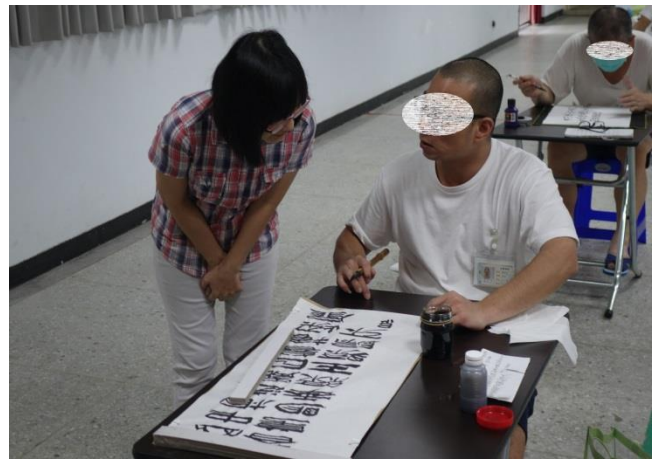
書法比賽現場實況