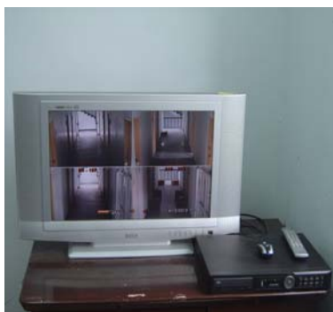
寢室走道加裝監視器