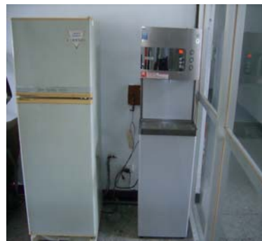
添置冰箱、逆滲透飲水機