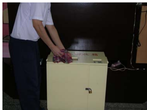
收容人投入即無法自行取出