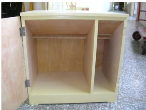
電池回收箱內部設計