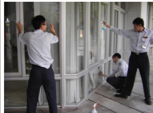
聖嘉民啟智兒童照顧中心周邊環境