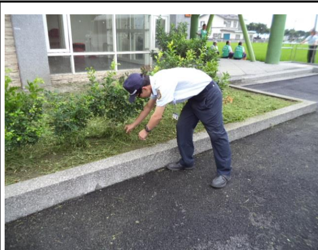
拱照村周邊環境清潔維護。