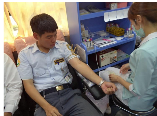
役男逐一進行捐血調查。