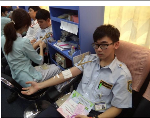
出發前宣導注意事項。