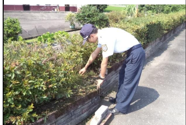
萬富活動中心周邊環境清潔維護。

效益分析：為展現本監服勤役男關懷鄉土、熱心公益形象，利用備勤時段，配合本監社區聯合服務隊至附近社區從事環境整理等敦親睦鄰工作，提昇本監公益服務之形象。