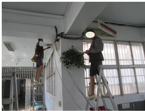
中央臺配線鋪水泥