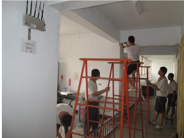
標記及固定安裝位置