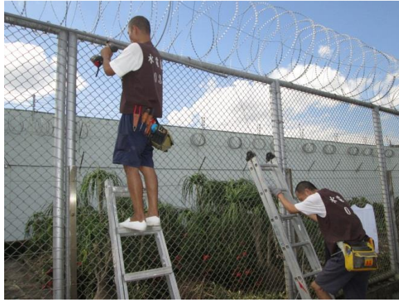
檢測蛇網是否老舊_1