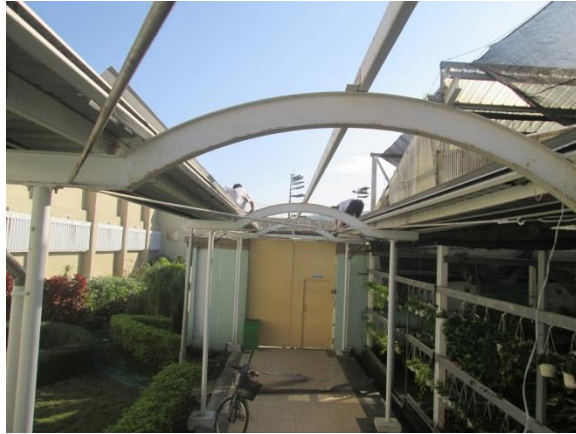
清除原先老舊鐵皮