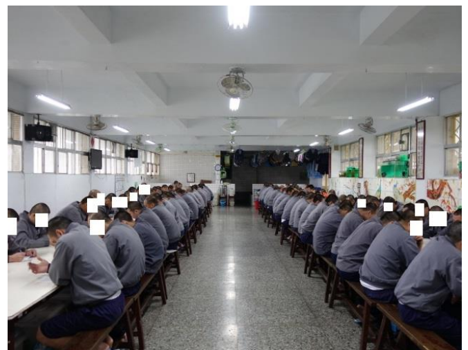
收容人專心應試情形