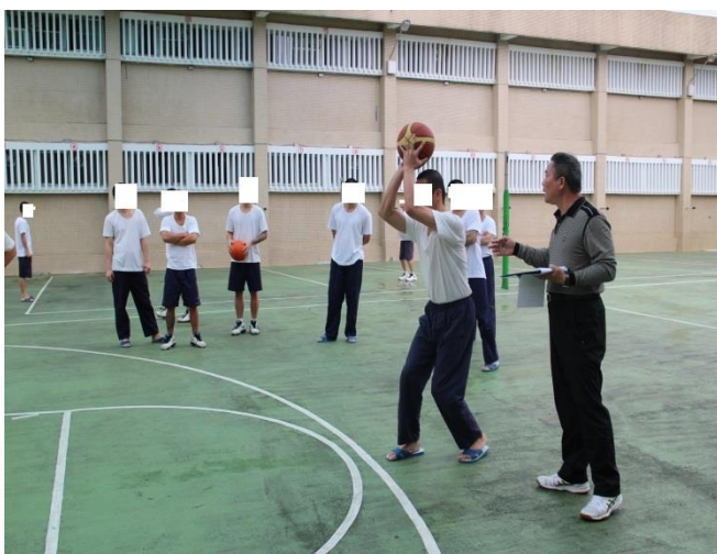
由教誨師宣導比賽規則