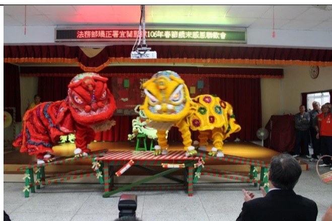
五工場新春舞獅表演