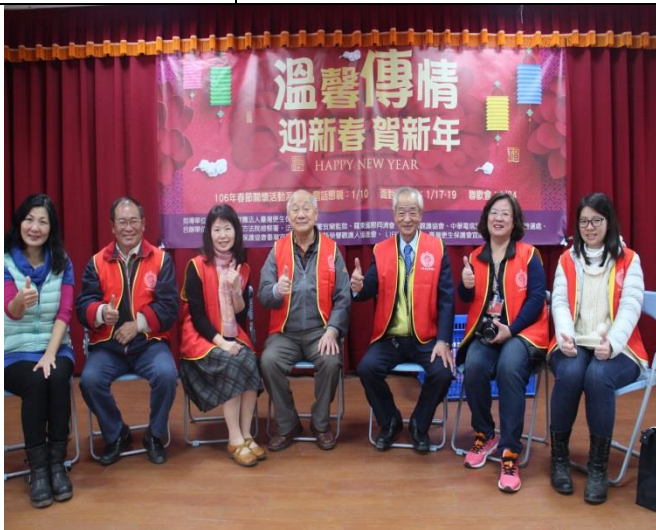
宜蘭更生保護會合影