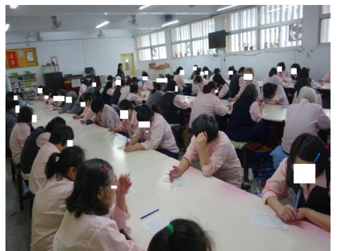
由主管擔任監考人員