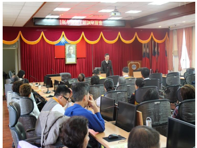
周科長軒立致感謝詞