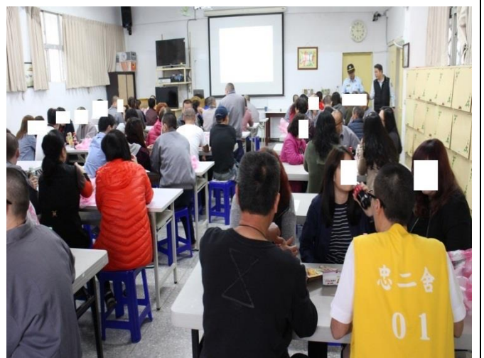
受刑人與家屬互動情形