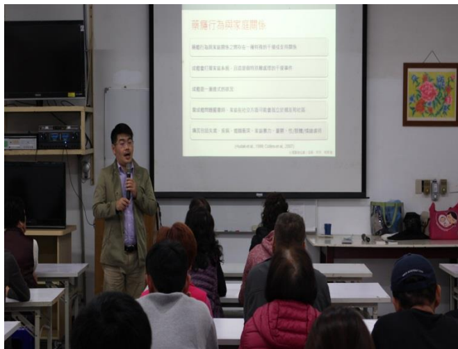
社工師對家屬宣導