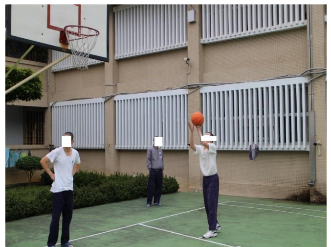
男監比賽進行實況