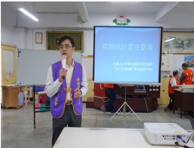
該會譚執行長宣導課程計畫