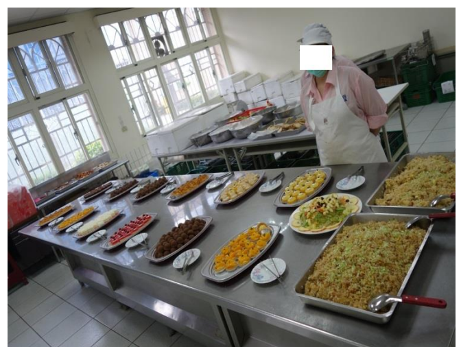
蔬食料理成果發表情形