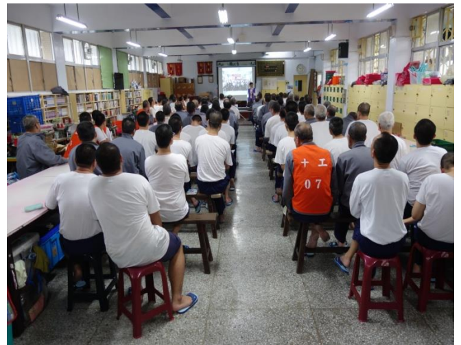
該會於工場宣導實況