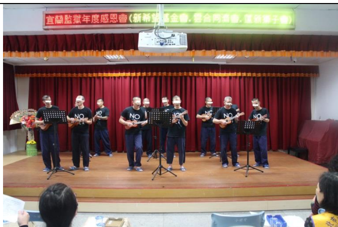
烏克麗麗現場表演