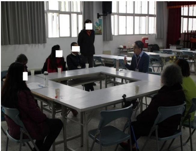
社工師與家屬交流意見