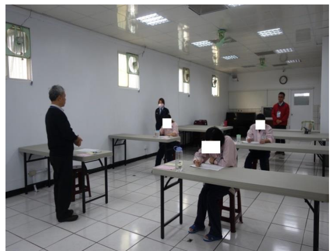
收容人專心應試作答