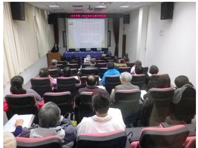
少觀所賴輔導員報告輔導情況