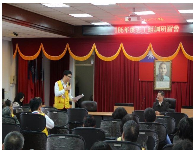
志工老師經驗分享