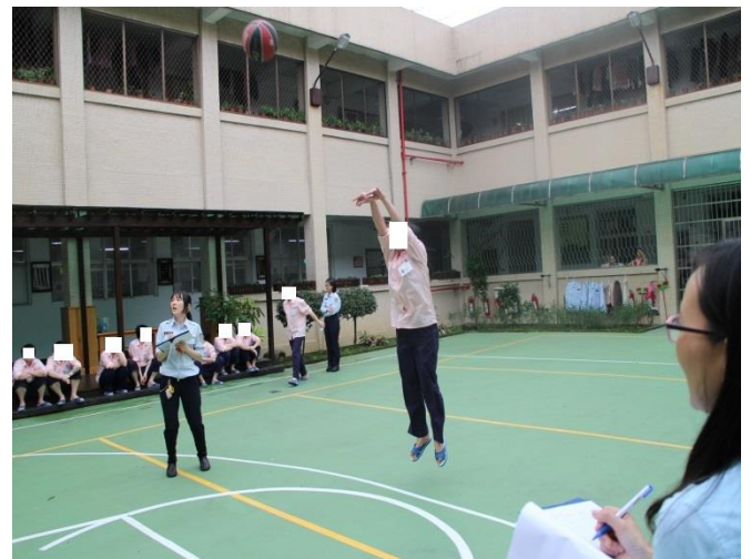
由教誨師和管理員擔任裁判