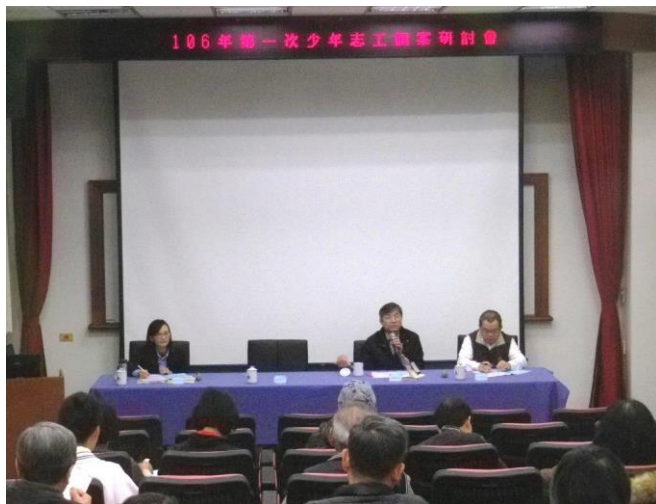
少觀所賴輔導員擔任專業指導