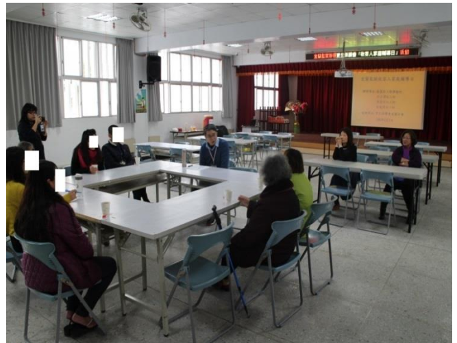
社工師對家屬宣導