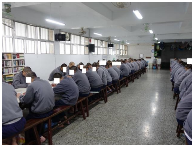
男監收容人法律會考情形