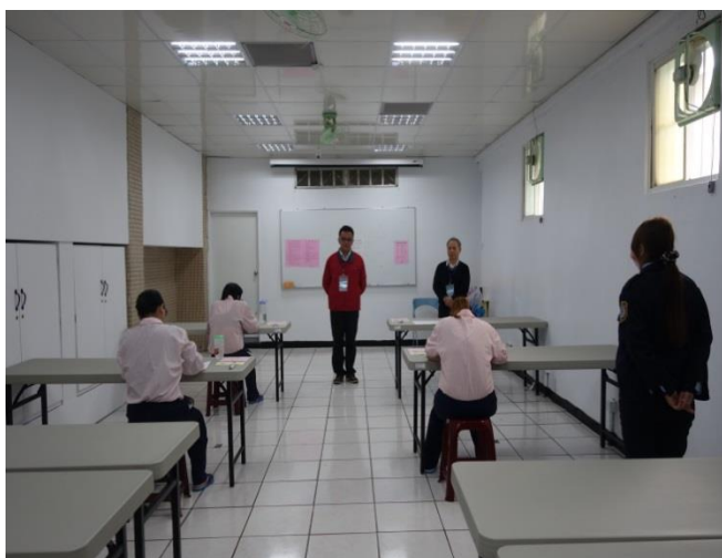
管理員戒護考場情形