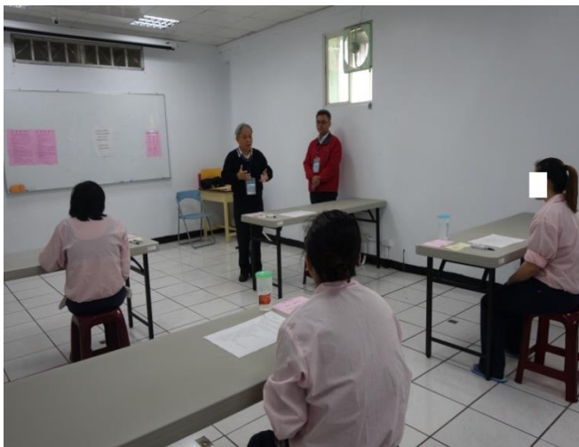
監考人員宣導考試規則