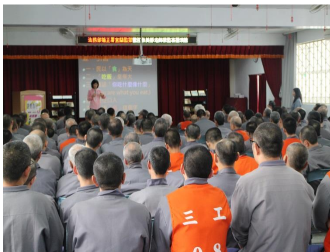
收容人聆聽演講現場