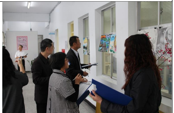
各位評審現場評分