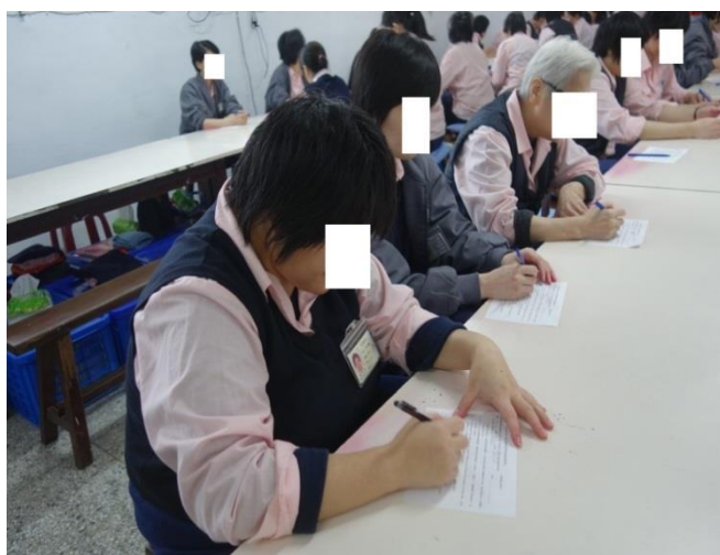
女監收容人法律會考情形