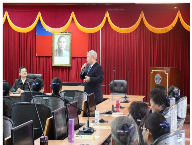
志工老師經驗交流