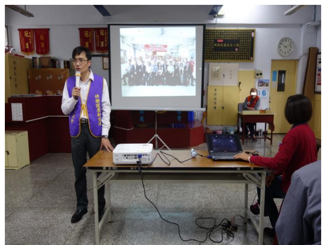
該會於工場宣導實況