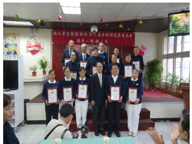
謝典獄長與指導志工老師合影