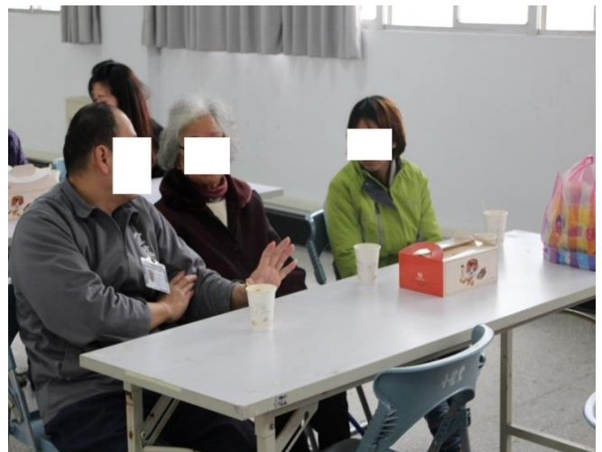
受刑人與家屬互動情形