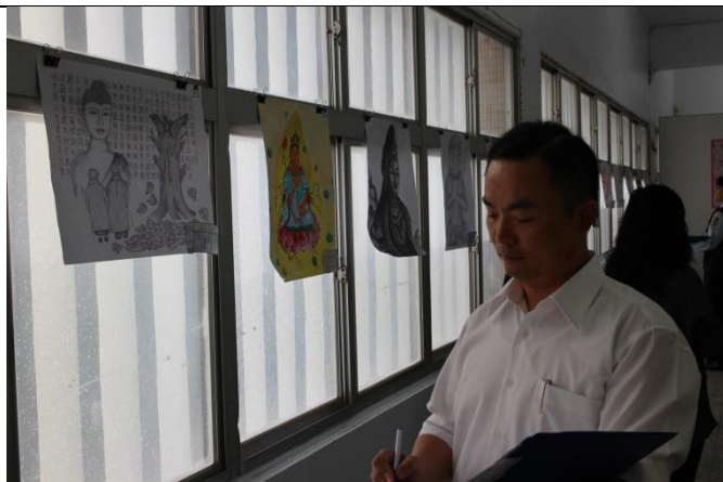
評審政風室主任評分