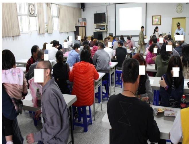
社工師對受刑人與家屬宣導