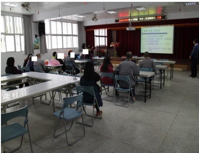
社工師對受刑人與家屬宣導