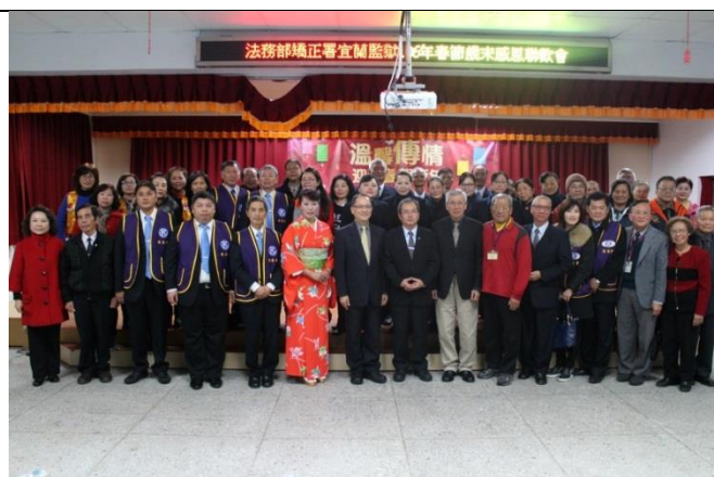
全體嘉賓與謝典獄長合影