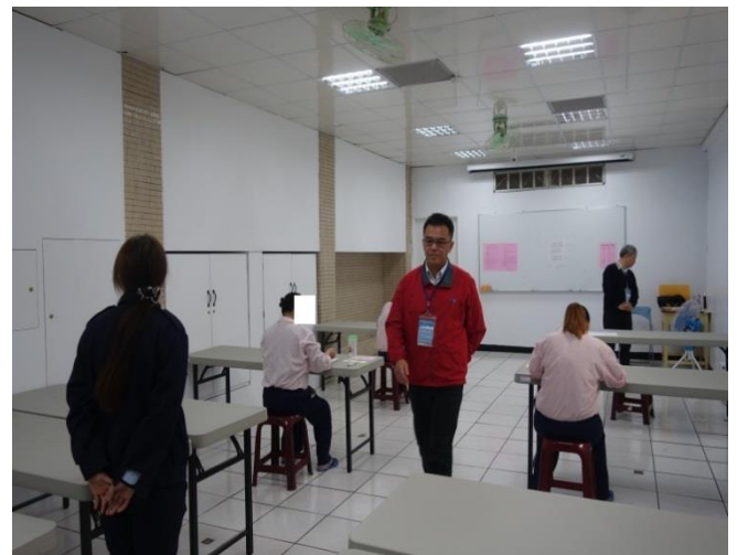
監考人員巡視考場情形