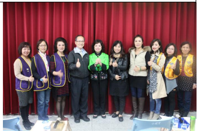
謝典獄長與孫董事和各會長合照