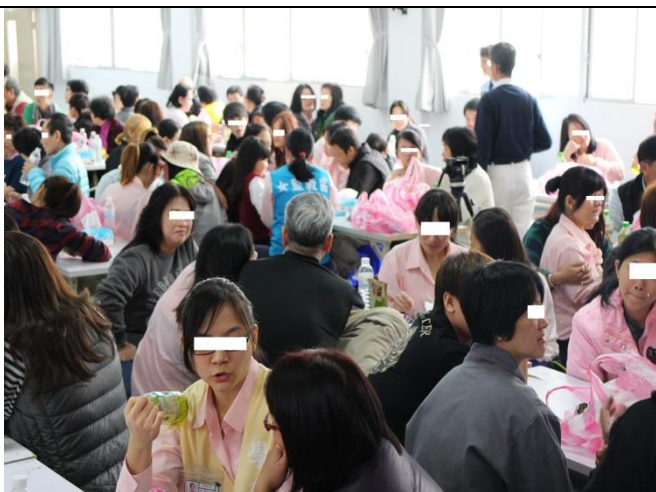
懇親活動辦理情形