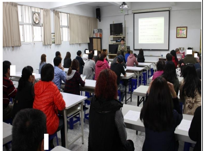
社工師與家屬交流意見