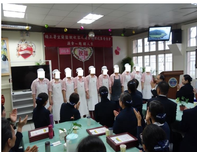
學習女收容人向來賓致謝