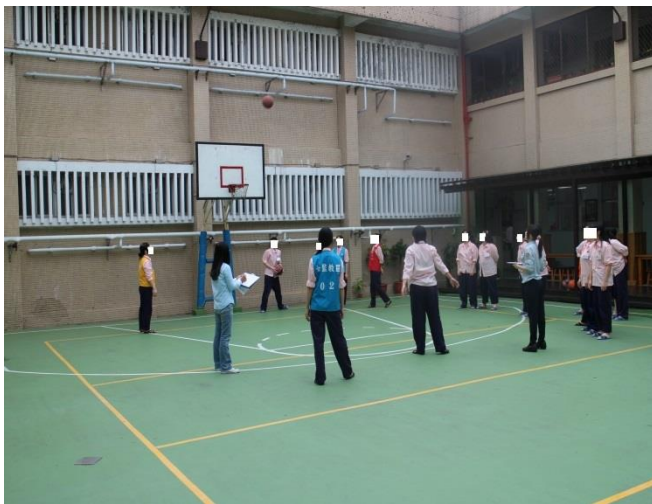
女監比賽進行實況