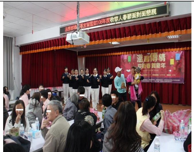
慈濟功德會「跪羊圖」演繹