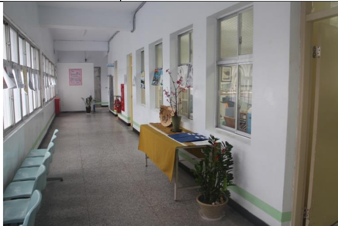
繪圖比賽評分現場